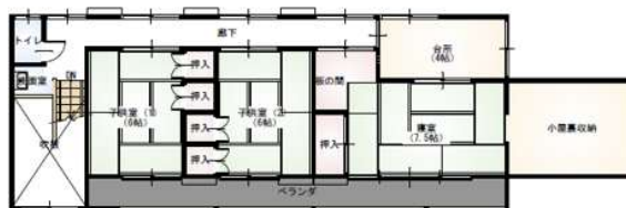
3階 平面図 S:1/100